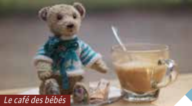
Le café des bébés