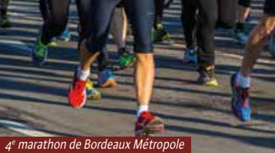
4 e marathon de Bordeaux Métropole