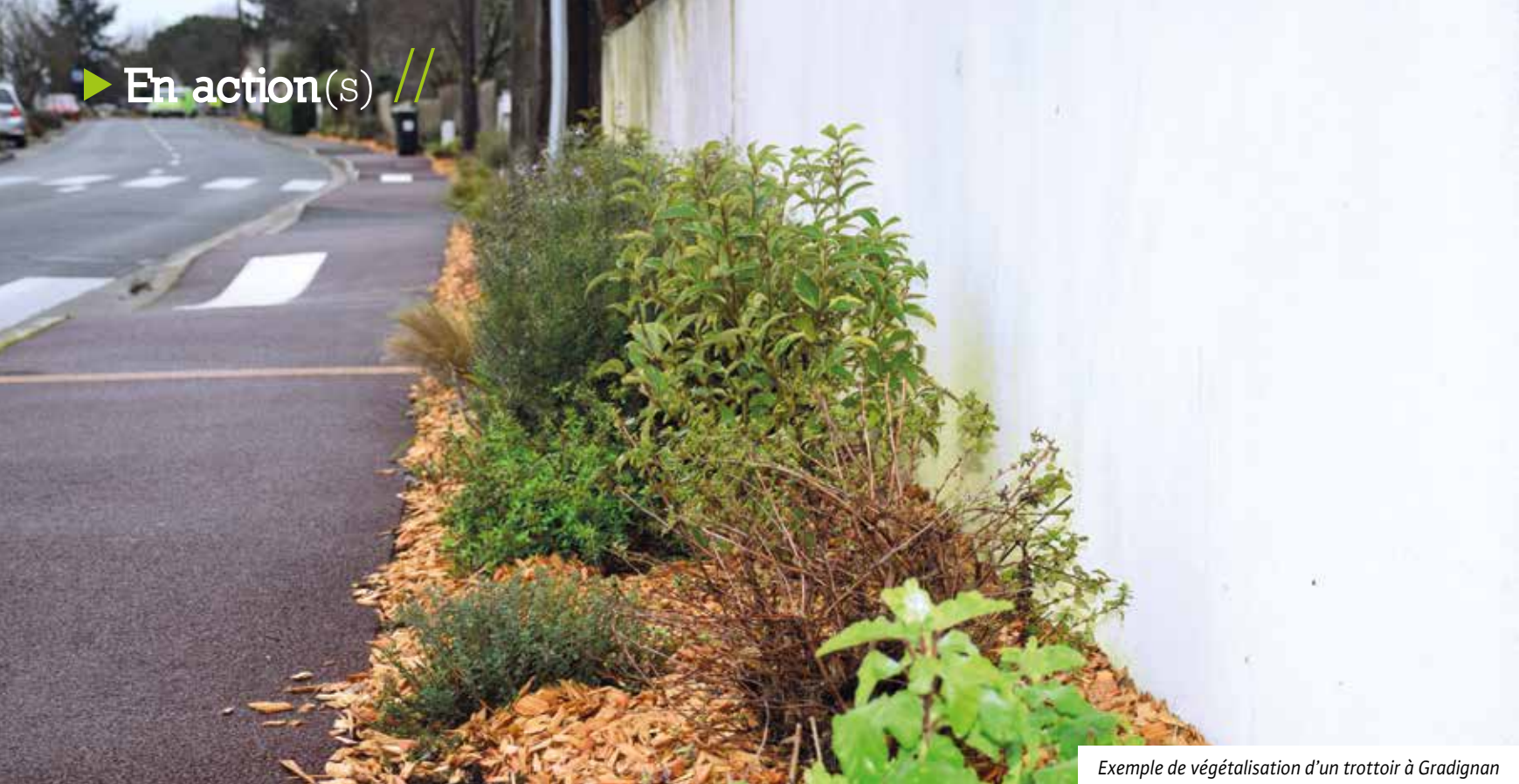
Exemple de végétalisation d'un trottoir à Gradignan