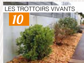
LES TROTTOIRS VIVANTS