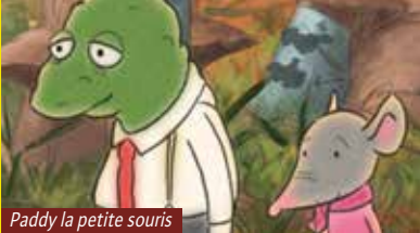
Paddy la petite souris