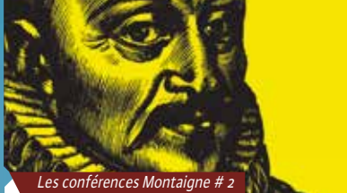
Les conférences Montaigne # 2