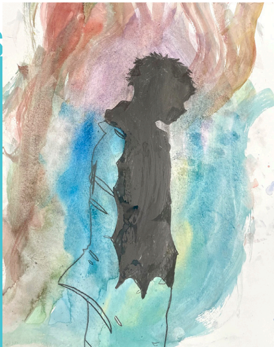
Illustration réalisée par un jeune de Pessac Animation